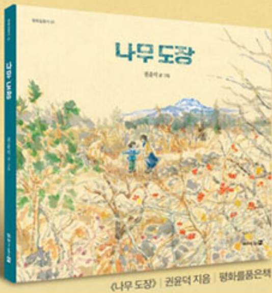
《나무도장》 | 권윤덕 지음 | 평화를품은책

제주4.3희생자유족회, 평화를품은집 (주)제주착한여행이 주최하여 2019년 권윤덕의 제주4·3 그림책 《나무 도장》 문학 기행에 여러분을 모십니다.